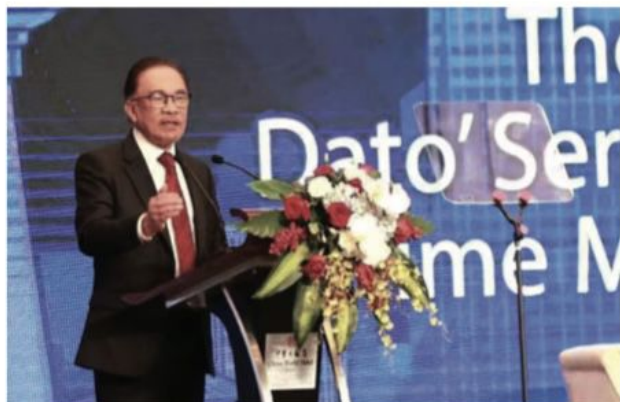
马来西亚首相拿督斯里安华发表主题演说。