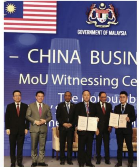
安华（中）见证亚太财经智库孵化器投资项目的战略合作签约仪式。左为陈永权博士，右为谢正一总裁。

列入国家级招商引资重点项目。马来西亚首相拿督斯里安华和6位马来西亚部长，以及来自马中两国的著名政商领袖，共同见证了此战略合作的签约仪式。