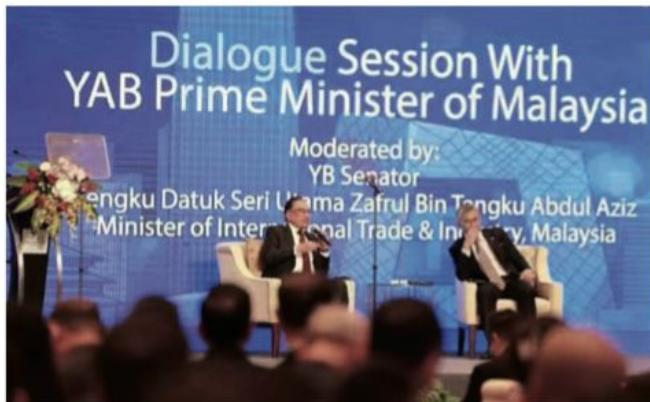
马来西亚首相拿督斯里安华（左）及国际贸工部长东姑扎夫鲁（右）接受媒体提问。